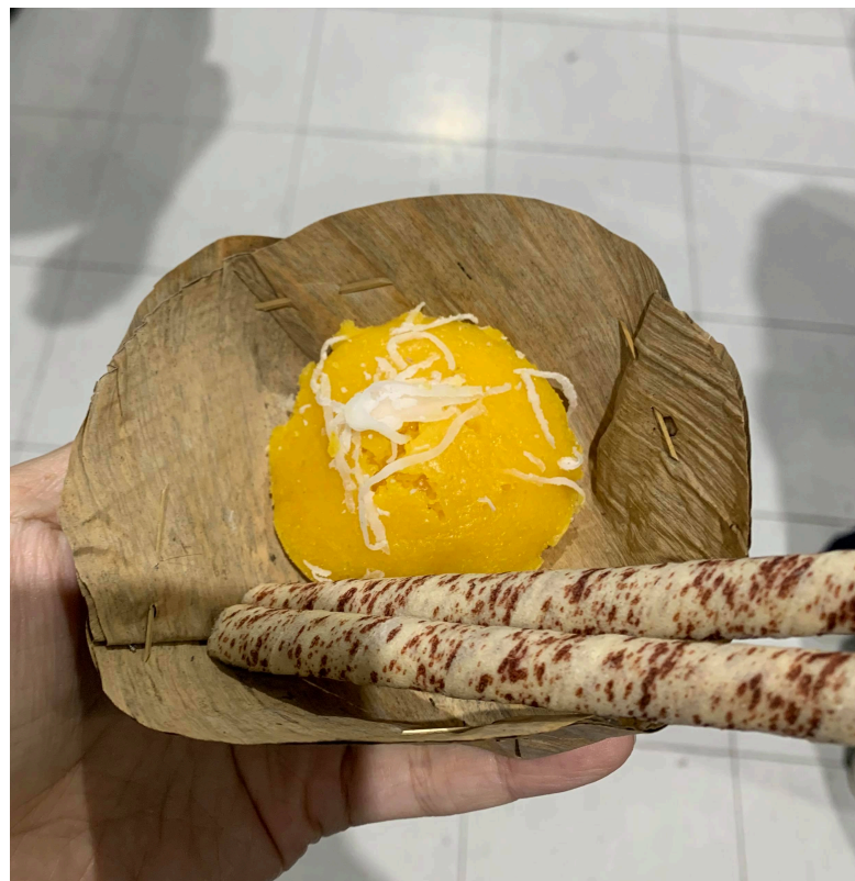
這是兩根脆笛酥，用來替代筷子