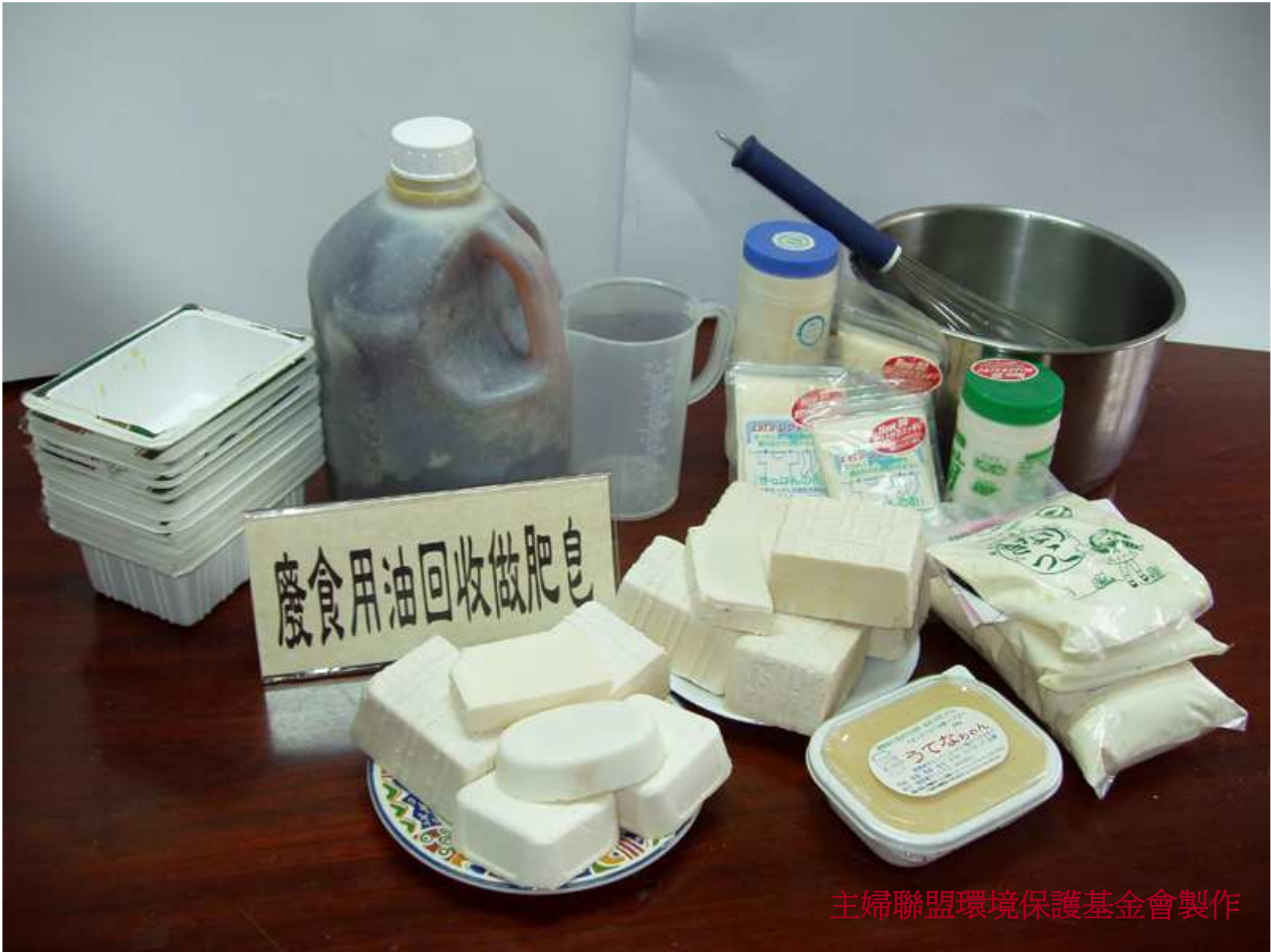
主婦聯盟環境保護基金會製作