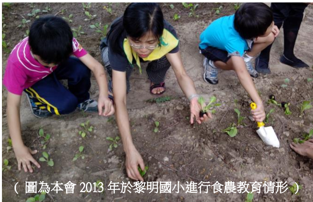
（圖為本會 2013 年於黎明國小進行食農教育情形）

為了號召眾人共同耕耘食物森林，各種工作派對（working party）因應而生，人們一同勞動、一起用餐，享受各種新鮮的食物！過程中穿插在地樂團即席演奏，振奮參與者的精神。除了收成森林中的果實，還有機會獲得林中蜜蜂生產的蜂蜜。