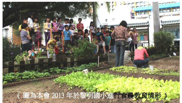
（圖為本會 2013 年於黎明國小進行食農教育情形）

從發想計劃藍圖開始，就以社區工作坊為起點，鼓勵民眾書寫或繪出自己的想法或各種創意構想，經由這種耐心且細緻的過程，讓整個計劃從草創階段，就注滿了在地的需求、夢想和期待，社區投入的動力自然也變得更加強大。